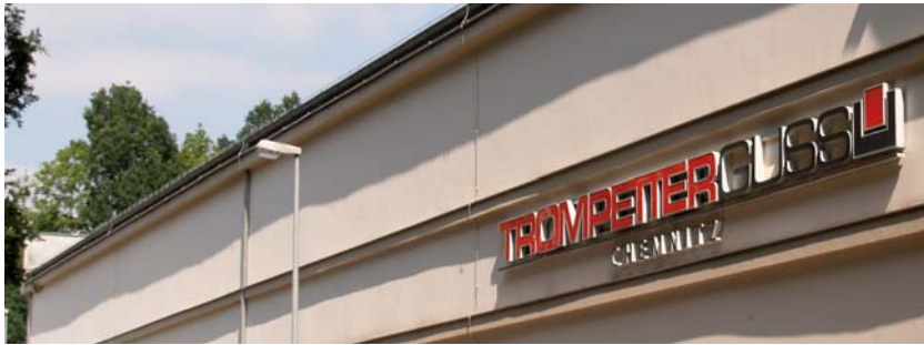
Seit Ende 2005 signalisiert die Firmen-Leuchtschrift, dass hier die Wende gelungen ist.