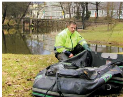
Ahoi für das Luft-Schiff