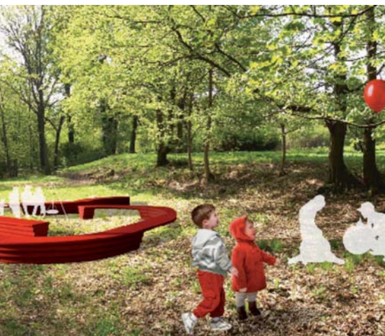
Ein kleines Hochplateau könnte Tummelplatz für Kinder werden.