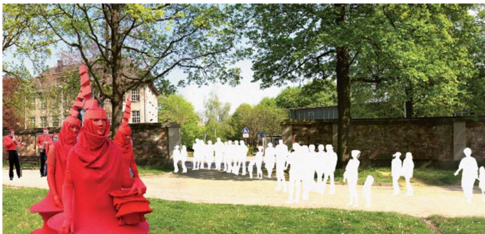
Wer wird künftig durch den bisher recht verlassenem Haupteingang zur Schönherrstraße Einzug halten? Welche Veranstaltungen wären prima?