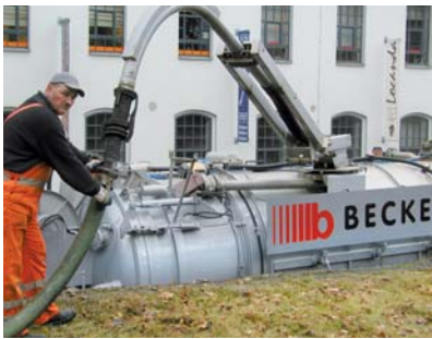
Rohr frei zum Abpumpen!