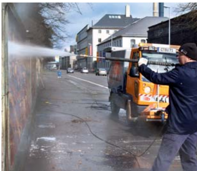
Kraftvolle Dusche für die Parkmauer