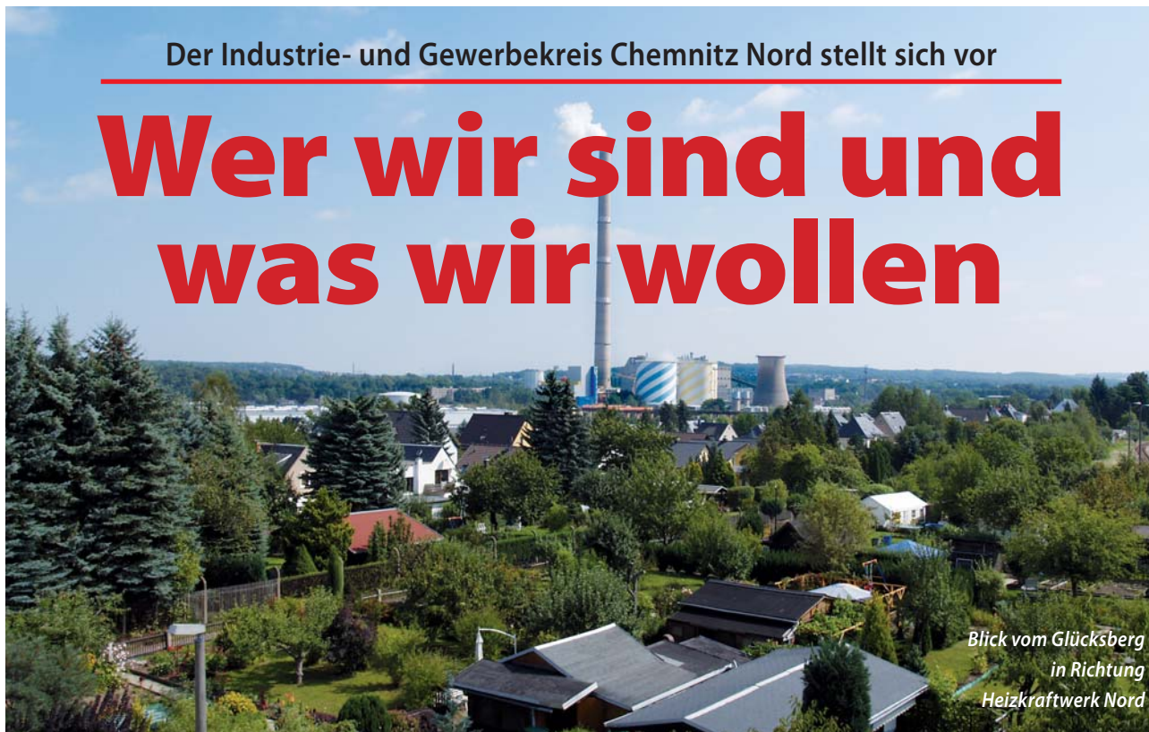
Blick vom Glückberg in Richtung Heizkraftwerk Nord

Auf dem Areal zwischen Blankenburg- und Blankenauer Straße im Chemnitzer Norden haben unterschiedliche Industrie- und Gewerbeunternehmen ihren Standort. Das Prinzip „Wohnen und arbeiten in der Stadt“ ist zukunftsweisend, stellt aber hohe