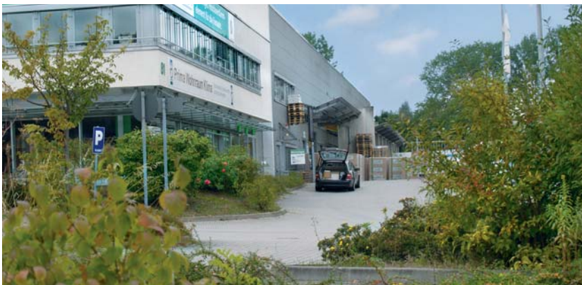
Unterschiedliche Unternehmen haben im Chemnitzer Norden ihren Sitz gefunden.

Arbeiten und Wohnen in Harmonie zu bringen – das müsste doch zu machen sein. Der Industrie- und Gewerbebereich dankt allen, die sich bislang geäußert haben, ob mit oder ohne Namen. Er befasst sich mit den Vorschlägen und wird sie in die weitere Arbeit einbeziehen. Weitere Vorschläge sind herzlich willkommen.